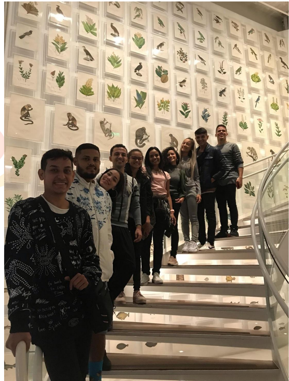
A Companhia em São Paulo, em agosto de 2019 para a estreia do espetáculo "D'Kebrada". Itaú Cultural.