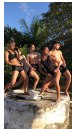
[duração aproximada: 60 minutos] Sala Itaú Cultural (piso térreo) - 224 lugares

Os bailarinos do Instituto Katiana Pena, de Fortaleza (CE), abordam suas origens e suas realidades em uma dança inspirada no cotidiano do bairro periférico de Bom Jardim.