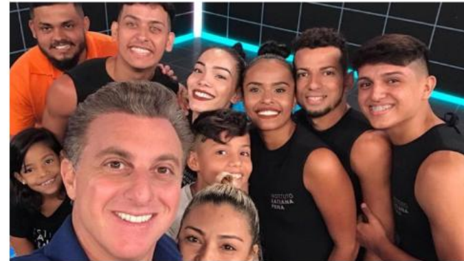
Alunos gravaram participação no programa "Caldeirão de Hulk" no Rio de Janeiro

Grupo de dança se apresentou no palco do "Caldeirão"